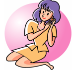
女性用品企画デザイン