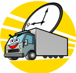
早朝・深夜・不規則労働